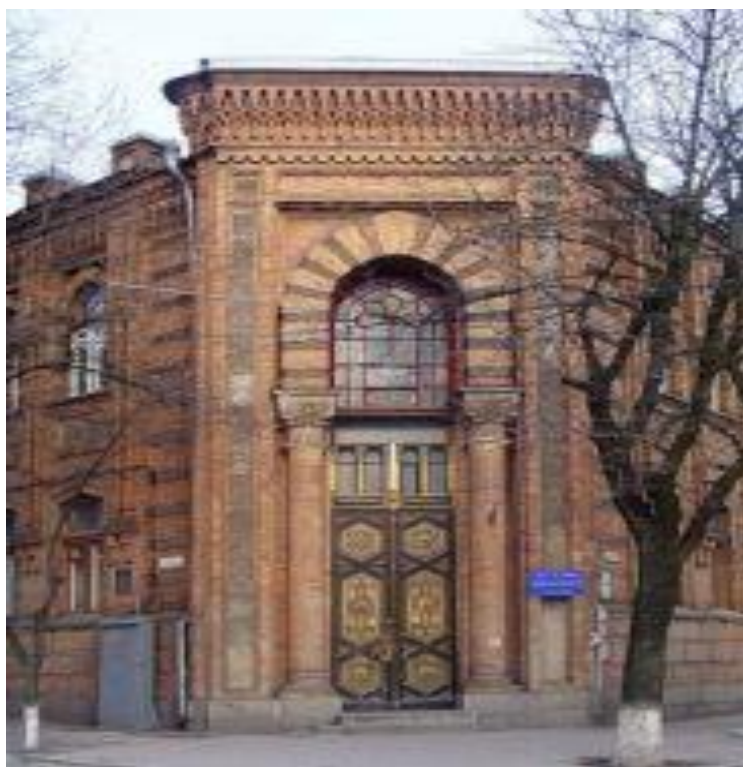
Рисунок 5. Фото Госпіталь Гольденберг

Будинок одного з найбагатших мірошників міста - купця Абрама Барського (пам'ятка архітектури поч. ХХ ст., нині обласний краєзнавчий музей).