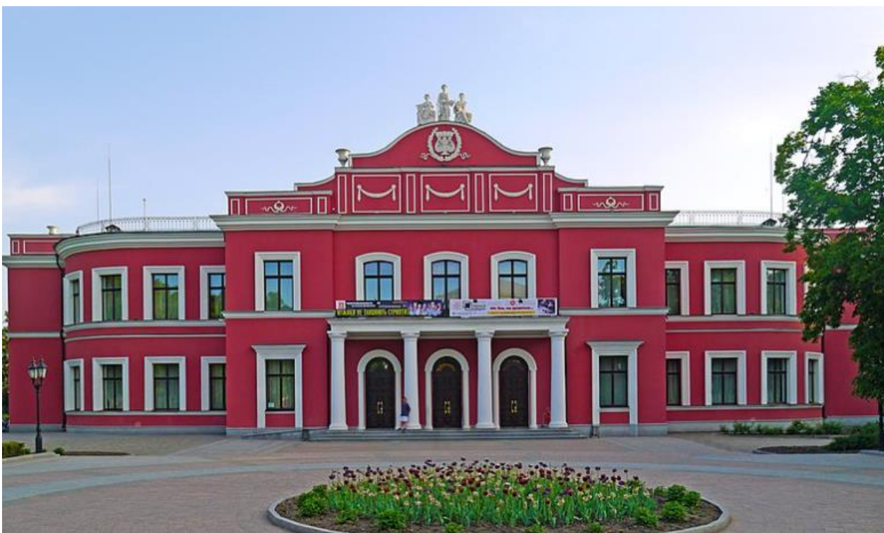
Рисунок 7. Фото Кропивницького академічного обласного українського музично-драматичного театру ім. М. Л. Кропивницького

А ще туристи прогуляються вулицею Дворцовою, на якій збереглися квартали забудови кінця ХІХ – початку ХХ ст.