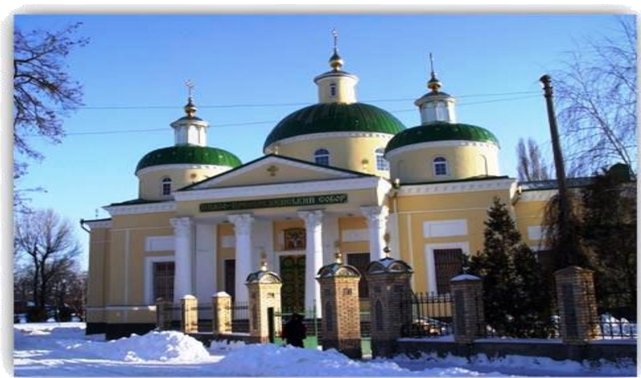
Рисунок 4. Фото Спасо - Преображенський собор (Кропивницький)

Храм збудовано в неокласичному архітектурному стилі. Одноповерхова будівля має три бані, вишуканий портик з чотирма колонами коринфського ордеру.