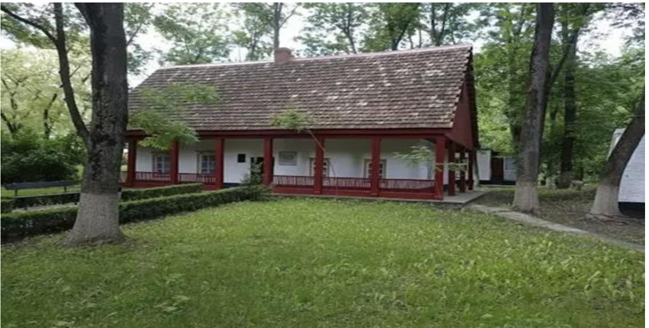
Рисунок 3. Фото хутора Надія

Під час екскурсії туристи познайомляться з історією цієї родини та дізнаються про їхній внесок в українську культуру.