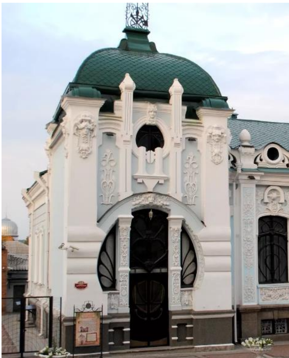
Рисунок 6. Театр корифеїв (Український обласний академічний музично-драматичний театр ім. Марка Кропивницького).

Кропивницький академічний обласний український музично-драматичний театр ім. М. Л. Кропивницького - обласний музично - драматичний театр у місті Кропивницький, перший професійний український театр, головна театральна сцена Кіровоградської області.