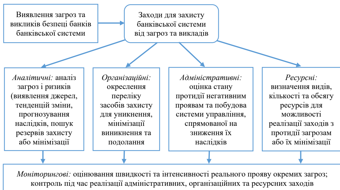
Рисунок 1 – Заходи для захисту банківської системи від загроз та викликів

На основі переліку виявлених загроз необхідно розробити заходи для збереження стійкості банківської системи від можливого їх виникнення або, в ідеалі, уникнення їх зовсім. Ці заходи мають спрямовуватися на попередження та протидію (рис. 1).