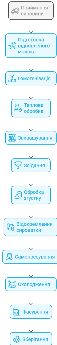
Рис. 2.1 Горизонтальна декомпозиція технологічної системи виробництва кисломолочного сиру

заквашування використовуються мезофільні молочнокислі культури, зокрема Lactococcus lactis subsp. lactis , Lactococcus lactis subsp. cremoris , які забезпечують поступове накопичення молочної кислоти та зниження рН до рівня 4.6 [17, с. 12].