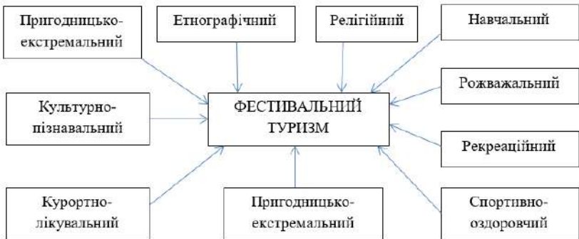
Рис. 9.1. Місце та зв'язки фестивального туризму з іншими видами туризму

Зважаючи на це, фестивальний туризм тісно інтегрується з іншими видами туризму (рис. 9.1).