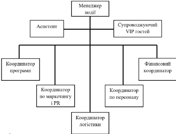
Рис. 4.1. Загальна структура організаційного комітету події.

Маріана Гучіка, оптимальна структура організаційного комітету для проведення «великої події» включає в себе наступні елементи (рис. 4.1):