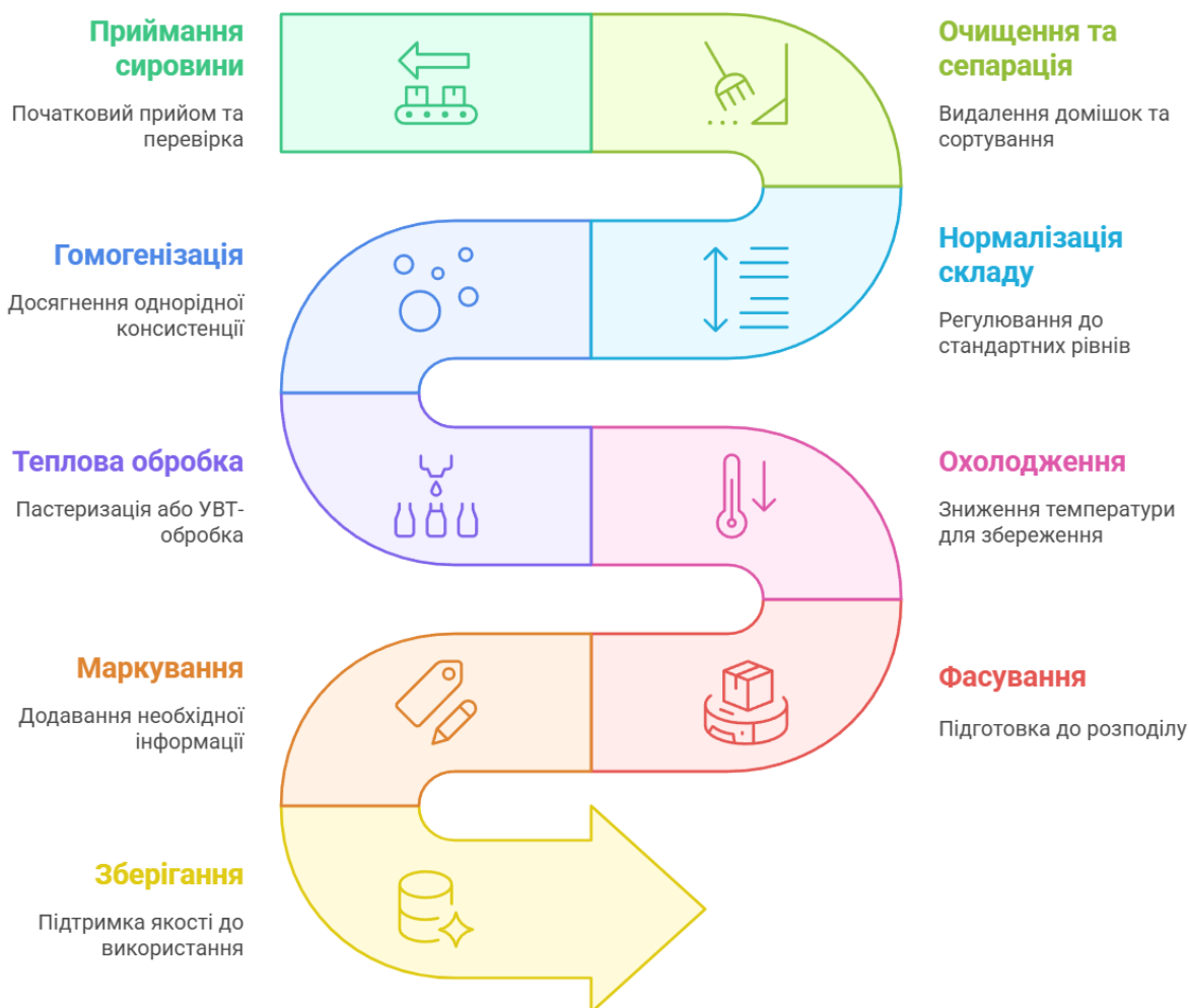
Рис. 2.1 Горизонтальна схема технологічного процесу виробництва та зберігання питного молока

етапі зниження мікробного навантаження відбувається на 30–40 %, що створює сприятливі умови для подальших етапів обробки.