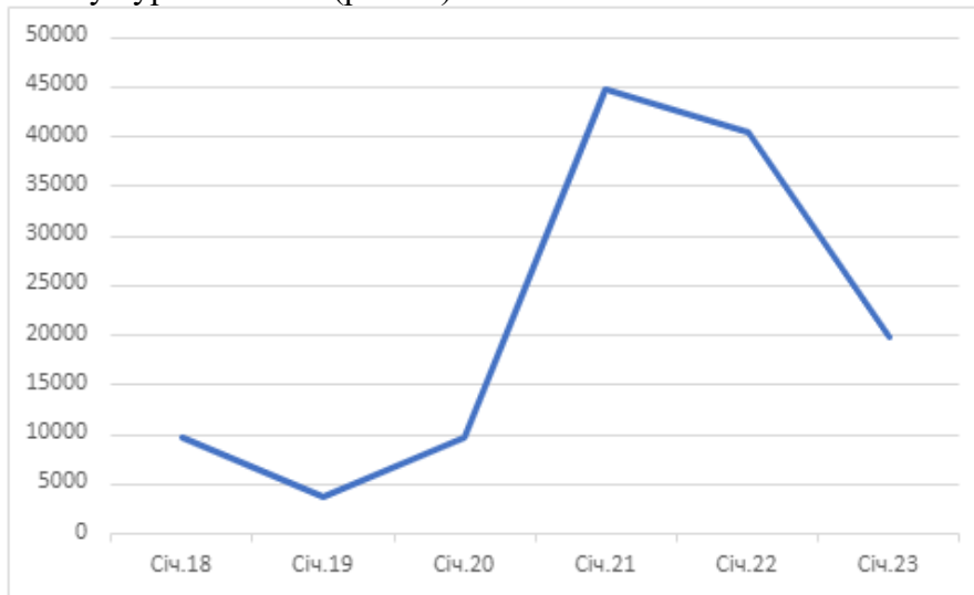
Рис. 1. Динаміка курсу Bitcoin у період з 2018 по 2023 рр.

отже, їх вартість, може як значно зрости, так і стрімко впасти. Так на тлі прецедентного зростання вартості Bitcoin протягом 2017 р. у період з 6 січня по 6 лютого 2018 р. його вартість впала на 65%, а 13 березня 2020, лише за добу втратив 50% своєї вартості. Для наочності розглянемо динаміку курсів Bitcoin (рис. 1.).