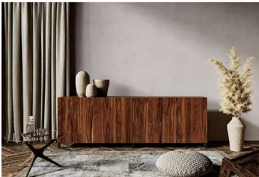
Рис. 2. Популярні матеріали для інтер'єру

Нові технології. 3D технології, що отримали у середині 2010-х рр. широке визнання громадськості знову повертаються в дизайн інтер'єрів. Нові можливості дозволяють використовувати в сучасних квартирах елегантні та витончені вироби, створені за 3D-технологіями. Це можуть бути витончені перегородки, керамічні вироби, плафони та навіть меблі.