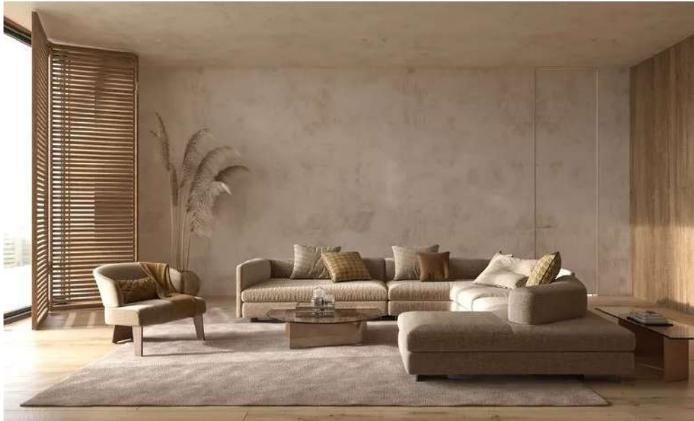
Рис. 3. Джапанді