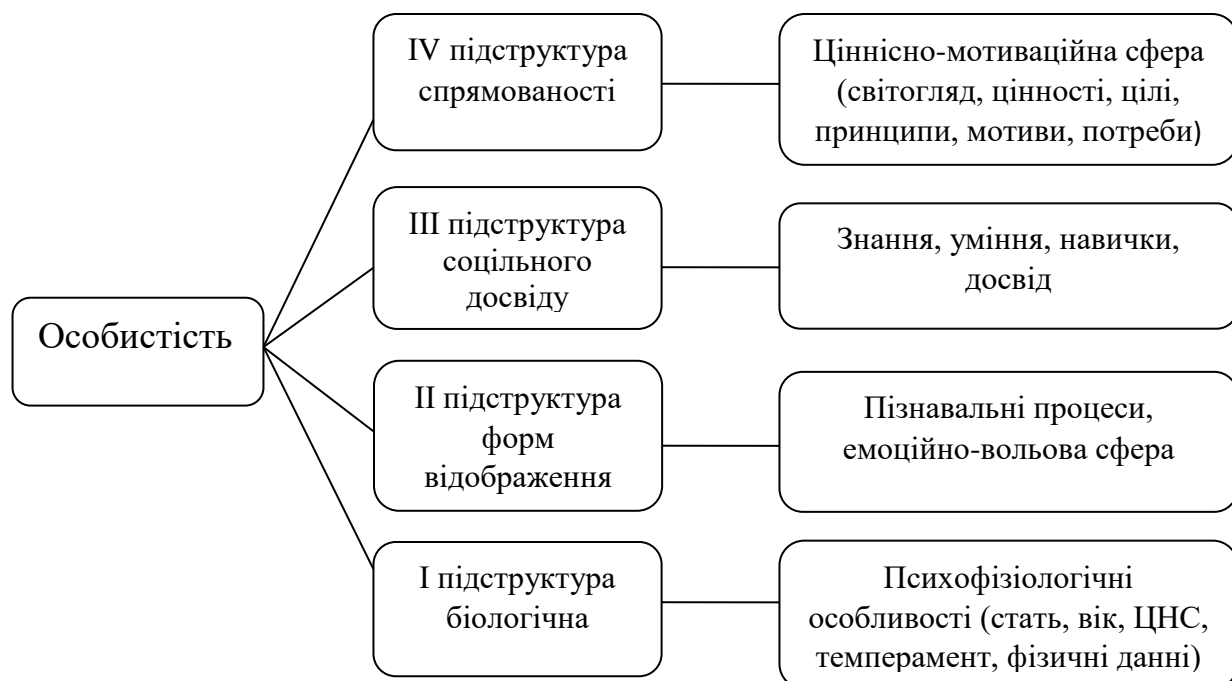
Рис.2.1. Структура особистості (К.Платонов)

Структура особистості. Теорія і методологія питання структури особистості у вітчизняній психології найбільш ретельно розроблені в роботах К.Платонова, який вживає вираз «функціональна динамічна структура особистості», розглядаючи її як складну відкриту систему, що саморозвивається (Рис. 2.1)