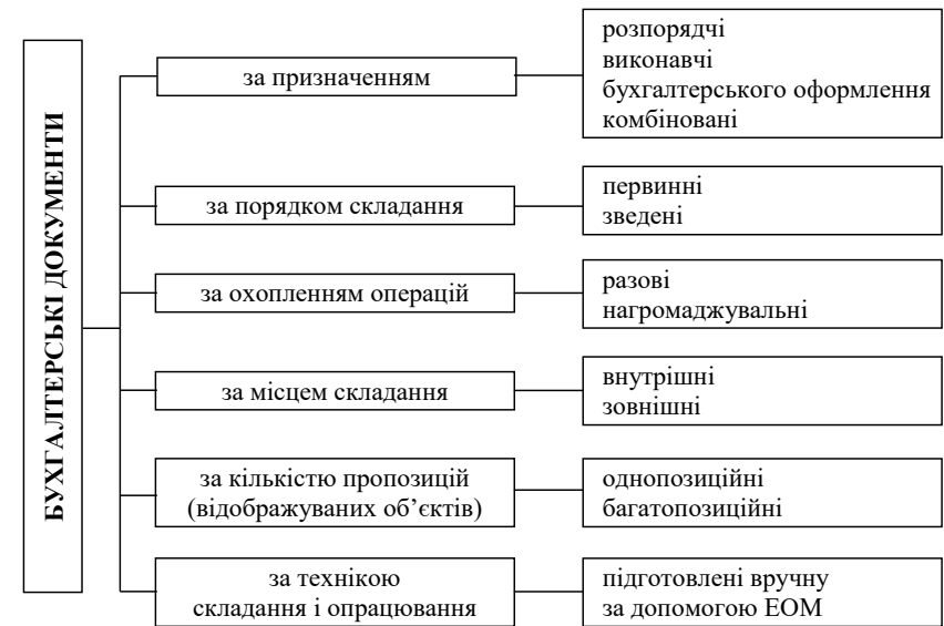
Рис. 2.1. Класифікація бухгалтерських документів [4]

Залежно від змісту господарських операцій, які підлягають документуванню, первинні документи поділяють на грошові, матеріальні та розрахункові.