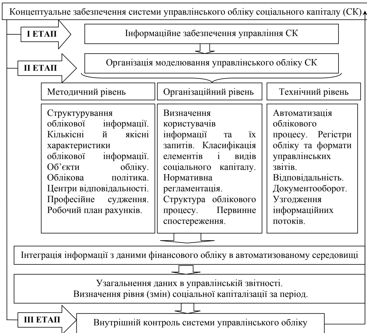
Рис. 1. Концепція моделювання системи управлінського обліку соціального капіталу торговельного підприємства

На нашу думку, моделювання в частині управлінського обліку соціального капіталу має бути детерміновано показниками соціально-орієнтованого бізнес середовища, а формування інформаційного забезпечення варто здійснювати на трьох етапах (рис. 1).