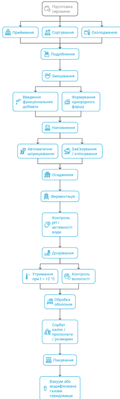
Рис 2.2 Ієрархічна декомпозиція технологічної схеми виробництва

бактеріоцини, перекис водню - сполуки, що створюють несприятливе середовище для росту мікроміцетів [5, с. 5].