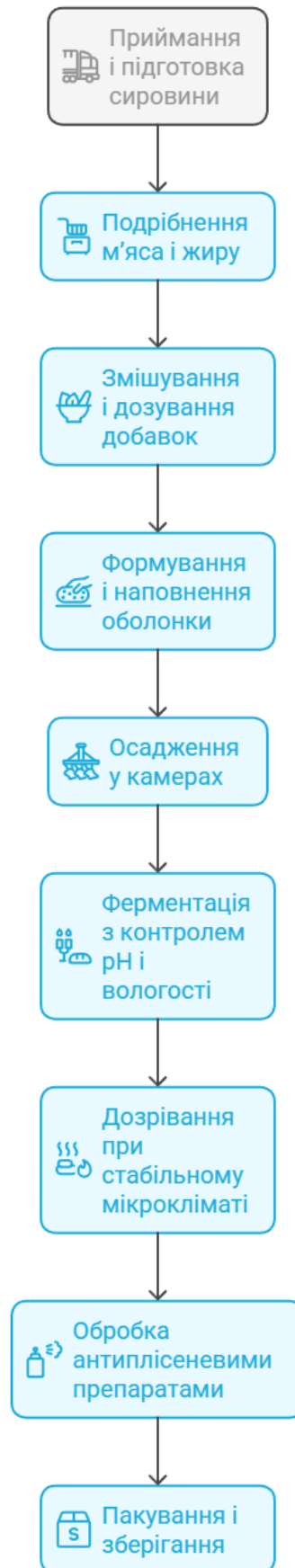
Рис 2.1 Горизонтальна декомпозиція технологічної системи виробництва сирокочених ковбас із антиплісневим ефектом