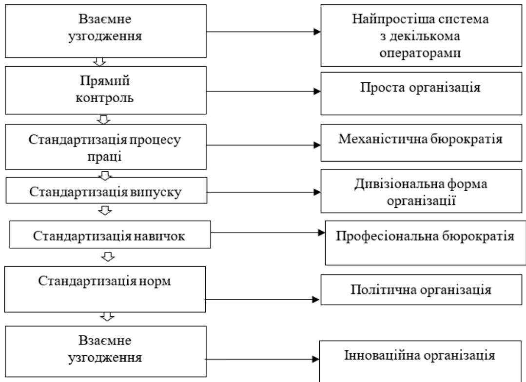
Рис. 2. Еволюція способів координації і їхній вплив на тип організації