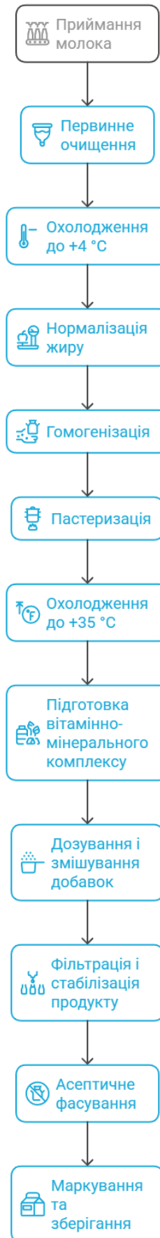
Рис. 2.1 Горизонтальна декомпозиція технологічної системи виробництва збагаченого питного молока