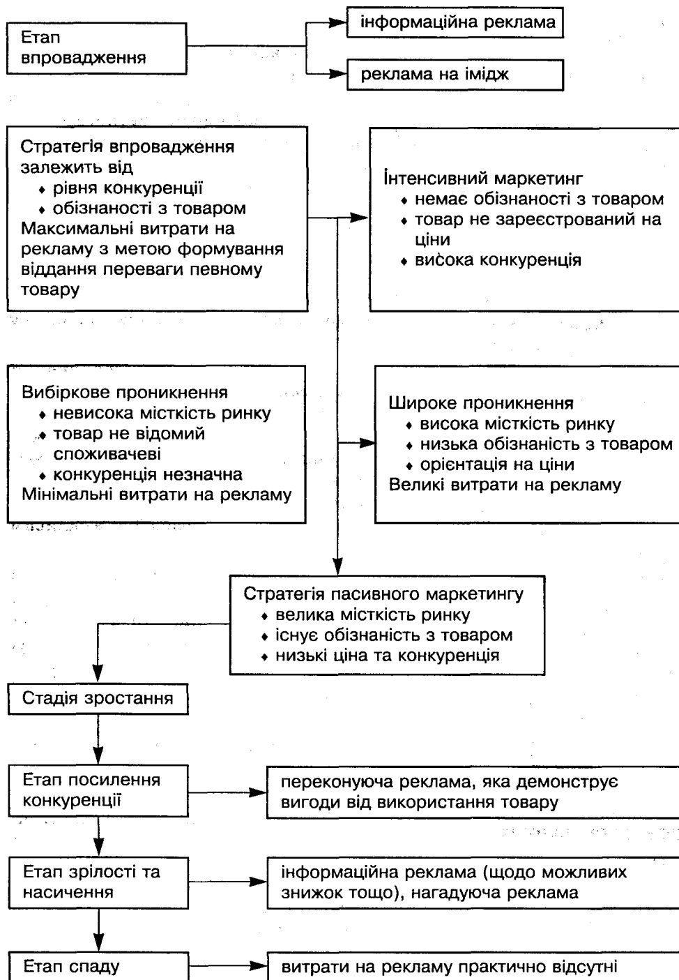
Рис. 1.1. Зв'язок цілей реклами та етапів життєвого циклу товару [18, 214]

Бізнес-довідники – це специфічний вид реклами, в якій потенційні покупці шукають інформацію і розміщують оголошення про продаж своїх товарів. Зараз в Україні видаються близько 40 довідників про підприємства та фірми.